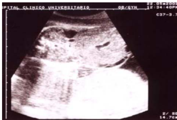
Figura 1. Corte transversal de abdomen. Obsérvese el defecto de pared abdominal (onfalocele) con el contenido hepático

No se realizó ecocardiograma porque la paciente entró en trabajo de parto espontáneo, con resolución obstétrica el 29 de mayo de 2002, con parto de un recién nacido de sexo femenino con signos vitales, peso en 2150 g. y talla de 47 cm. Las figuras 3 y 4 que se presentan muestran la patología observada en las imágenes ecocardiográficas (figuras 1 y 2). La niña fue ingresada a la terapia de cuidados intermedios del Servicio de Neonatología y falleció a las cuatro horas de vida post-natal. +