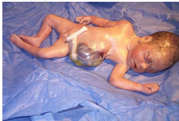
Figura 3. Obsérvese la hernia diafragmática, el hepatoonfalocele, la ectopia cordis y, cercano al tórax, el ápex cardíaco.