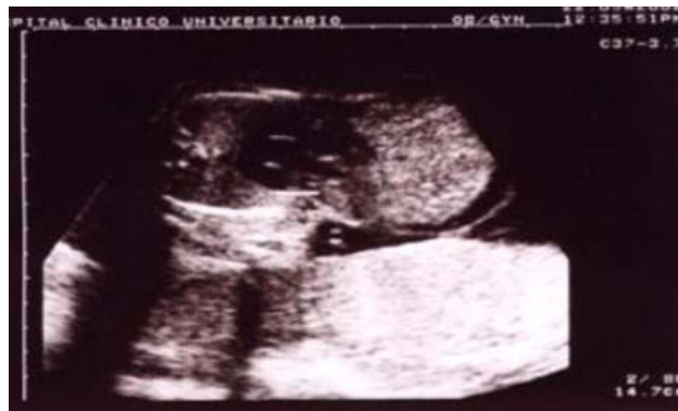
Figura 2. Corte transversal a nivel de la unión de tórax y abdomen, observándose la base del corazón y el onfalocele.