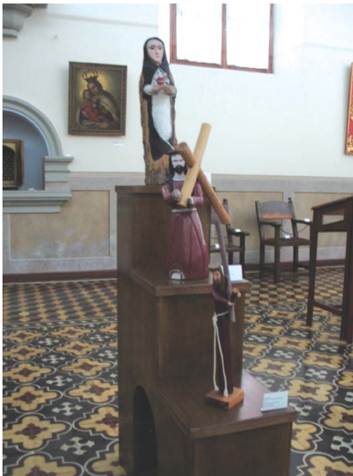
Muestra de la Exposición Temporal Cruces, Crucifijos y Nazarenos .

Continuando el recorrido, en la Sala 2 , se exhibe parte de la pinacoteca colonial; vale resaltar la obra Virgen de la Dolorosa , óleo sobre lienzo del año 1700. Conjuntamente, se conserva una valiosa colección de pinturas de la Escuela Merideña, representada por su principal exponente, el pintor José Lorenzo de Alvarado. Además, permanece la exposición de indumentaria y objetos litúrgicos.