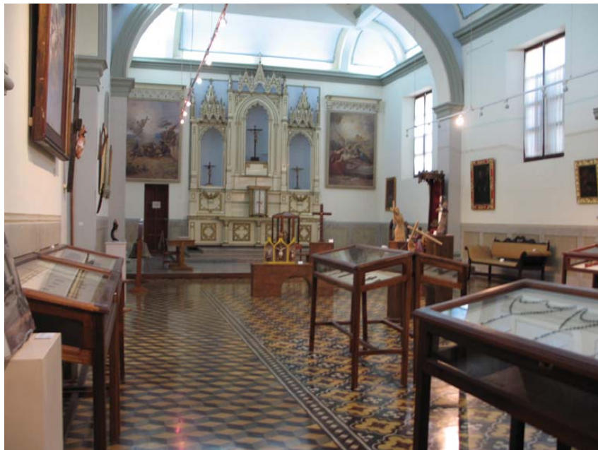
Sala 1 del MAMSG. Exposición Temporal Cruces, Crucifijos y Nazarenos .

En exposición permanente el público puede encontrar pintura colonial, como El Descenso de la Cruz y escultura de la misma época, de la cual es oportuno destacar un crucifijo atribuido al escultor Manuel Chili (Caspicara), indígena que desarrolló su labor en Quito, a mediados del siglo XVIII y otro crucifijo atribuido al escultor Gaspar Sangurima (Lluqui), nacido en Cuenca, Ecuador. Al mismo tiempo, puede observar campanas de Iglesia, mobiliario litúrgico y doméstico que forman parte de la Colección del MAMSG.