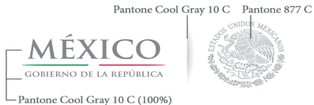
Figura 8. Color