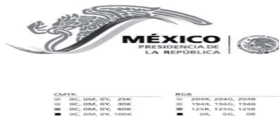
Figura 4. Contratipos