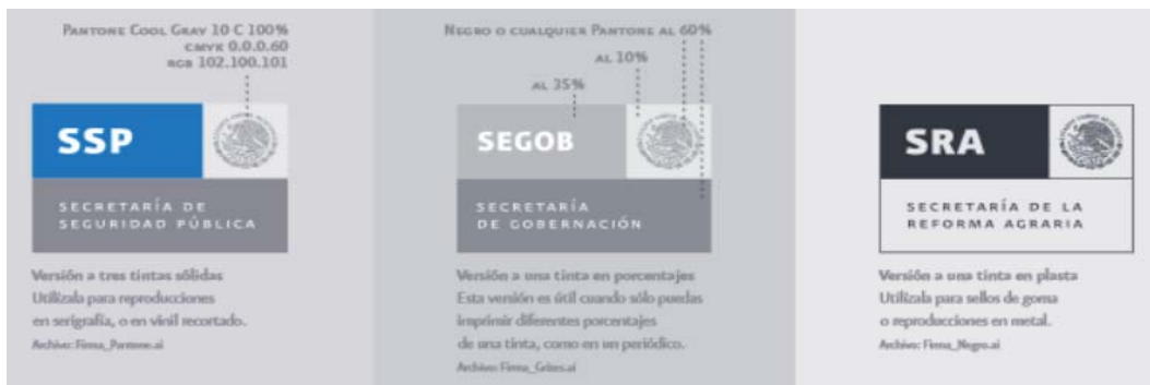
Figura 6. Color y contratipos