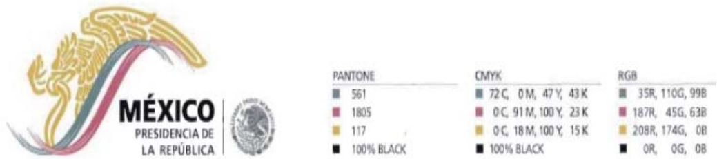
Figura 2. Color