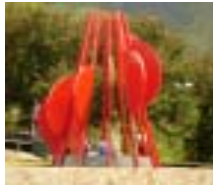
Hitos del Molino