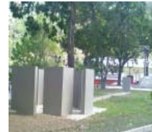
Homenaje al cuadrado y al agua de los Andes