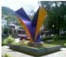
Tensión y torsión